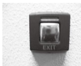
退室ボタン (2号館・5号館)