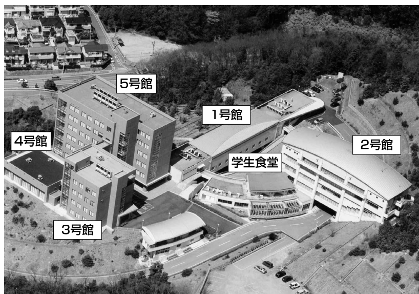
（キャンパス案内図）