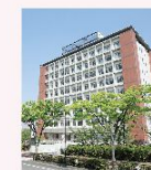
人間環境大学 大府キャンパス

これからの助産師は、正常産のみならずハイリスク妊婦・新生児への対応や女性の生涯にわたる健康問題への対応能力、そして周産期医療の課題を分析して変革する視点をもつことが求められています。人間環境大学大学院看護学研究科では、修士の学位をもち、エビデンスに基づく高度助産実践能力を発揮して、本学が立地する大府市近隣を中心に地域に視野を広げ、現状を分析できる研究能力を備えたリーダー・管理者・教育者を目指す助産師を育成します。