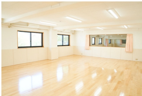
プレイルーム 1 の様子