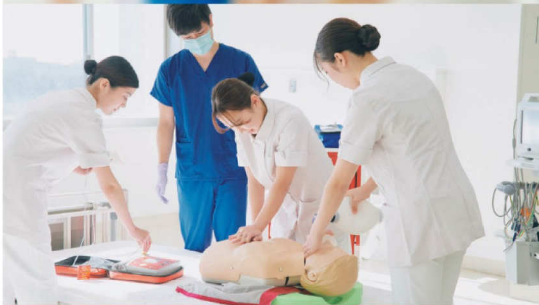
看護の精鋭としての高度な知識とスキルを身につける